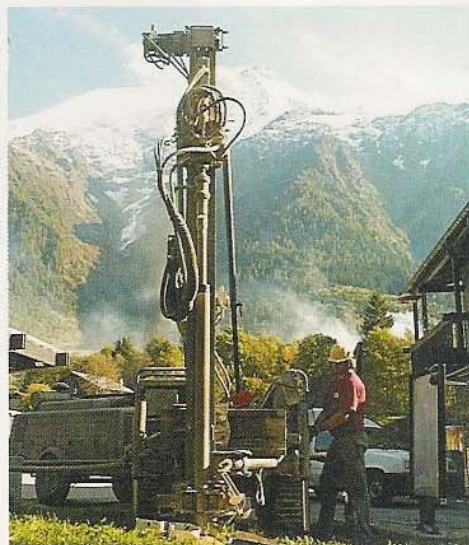
Campagne de sondages