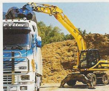
Valorisation des déchets industriels