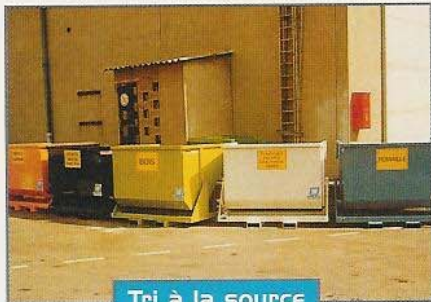
Tri à la source