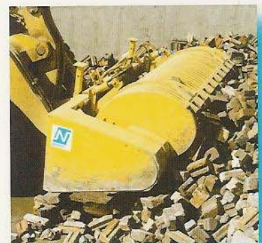
Valorisation des démolitions industrielles